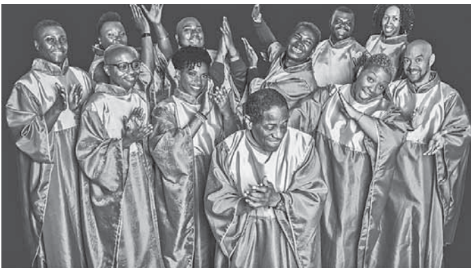
Mit „The Golden Voices of Gospel“ live auf der Bühne stehen.

Der Einlass zu Workshops und Show erfolgt nur mit Nachweis für geimpfte und genesene Personen oder gegen Vorlage eines maximal 48 Stunden zurückliegenden PCR-Tests. Besucherdaten werden vornehmlich über die LUCA-APP erfasst, die sich die Besucherinnen und Besucher im Vorfeld über Google Play oder den App Store downloaden und damit registrieren können. Die Gäste werden gebeten, sich an die aktuellen Schutz- und Hygienevorschriften zu halten.