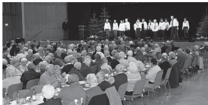
Bildunterschrift: Die Line-Dance-Gruppe des DRK bei der Seniorenweihnachtsfeier.