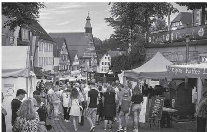
Bildunterschrift: Standbetreiber auf dem Straßenfest 2022

Das Online-Anmeldeformular und alle Informationen, wie Teilnahmebedingungen, Preisliste, sowie Vergabekriterien sind auf der Homepage des Backnanger Straßenfestes unter www.backnanger-strassenfest.de/mitmachen zu finden. Bei Fragen kann das Festivalbüro der Stadt Backnang unter Telefon 07191 894-616 oder per Mail an strassenfest@backnang.de erreicht werden.