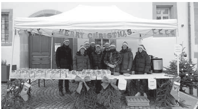
Bildunterschrift: Ausgabe der Heißgetränke und der Nikolaustüten beim ersten Weihnachtswochenmarkt in Backnang

Am Samstag, 10. Dezember, fand erstmalig der Backnanger Weihnachtswochenmarkt statt. Ab einem Einkaufswert von fünf Euro auf dem Wochenmarkt erhielten Kundinnen und Kunden einen Gutschein für einen Glühwein oder Punsch sowie Kinder einen Gutschein über eine Tüte mit Fairtrade-Nikolaus. All diese Gutscheine konnten an der geschmückten Weihnachtsstation vor dem Rathaus eingelöst und an den weihnachtlich dekorierten Stehtischen rund um den dort verorteten Weihnachtsbaum genossen werden.