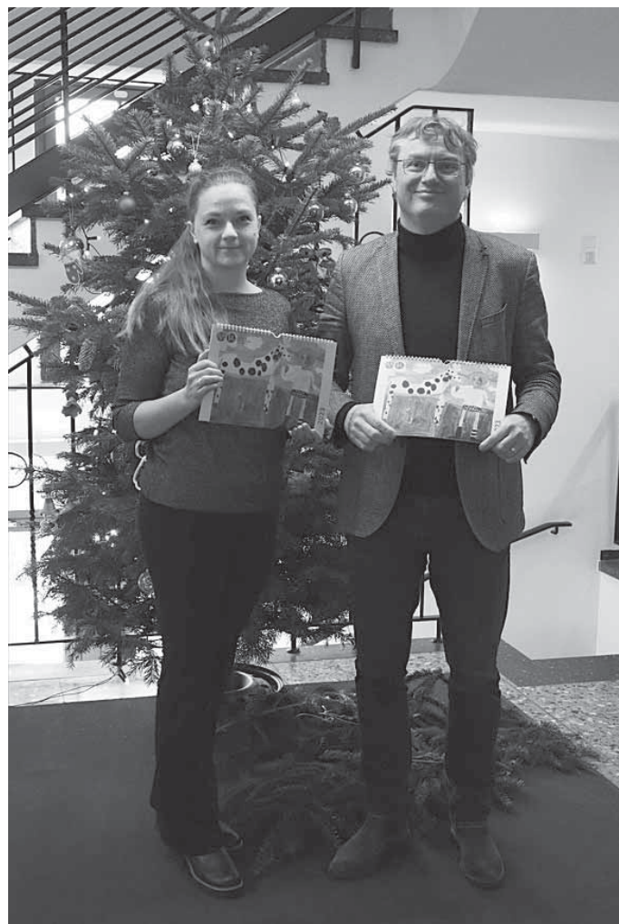
Bildunterschrift: Jahreskalender JMKS

Die Jugendmusik- und Kunstschule bringt nach der Premiere im vergangenen Jahr wieder einen Wandkalender heraus. Die Bilder der einzelnen Monatsblätter für das kommende Jahr 2023 widmen sich ausschließlich dem Bereich Kunst und beinhalten Bilder von Arbeiten aus unseren Kunstklassen.