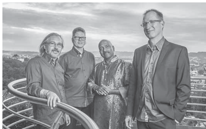
Ensemble Noisten WKT 2024

Das Winterkultur-Konzert in der Limpurghalle beginnt um 18 Uhr; Einlass ist ab 17:30 Uhr. Tickets sind im Vorverkauf zu 10 Euro (ermäßigt 3 Euro) erhältlich. Für Schülerinnen und Schüler bis 12 Jahren ist der Eintritt frei. Kontakt und Karten: Buchhandlung Schagemann, Telefon 07971/44 33 sowie Bürgerbüro Gaildorf, Telefon 07971/253 111 oder events@gaildorf.de