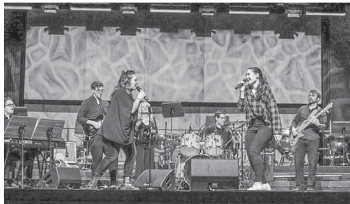
Gesangsolistin der Jugendmusik und Kunstschule.