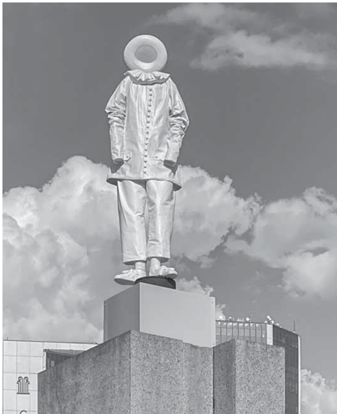
Gilles, Arbeit von Anja Luthle

Die Plastiken und Installationen von Anja Luthle verwandeln den Ausstellungsraum in eine lebendige Bühne. Hier scheinen die Objekte zu performen und stellvertretend für Schauspieler*innen vielfältige Rollen zu übernehmen. Die Motive und Handlungen behalten das Alltägliche im Auge, aber das Geheimnis der Kunstwerke liegt in der Rolle des abwesenden Menschen, der den eigentlichen Kern der Aussage bildet. Das Spiel entfaltet sich in der Vorstellungskraft des handelnden und erlebenden