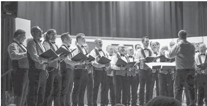
Die Sänger mit Leidenschaft beim Auftritt

19:30 Uhr das Licht im Saal aus und der Vorhang öffnete sich. Die Veranstaltung wurde mit dem altbekannten Lied „Lieder die von Herzen kommen“ von den Sängern eröffnet.