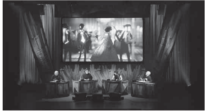
Dr. Jekyll und Mr. Hyde gastieren im Backnanger Bürgerhaus

buergerhaus.de sowie zu den üblichen Öffnungszeiten im Bürgerhaus, unter 07191 894-567 und buergerhaus@backnang.de