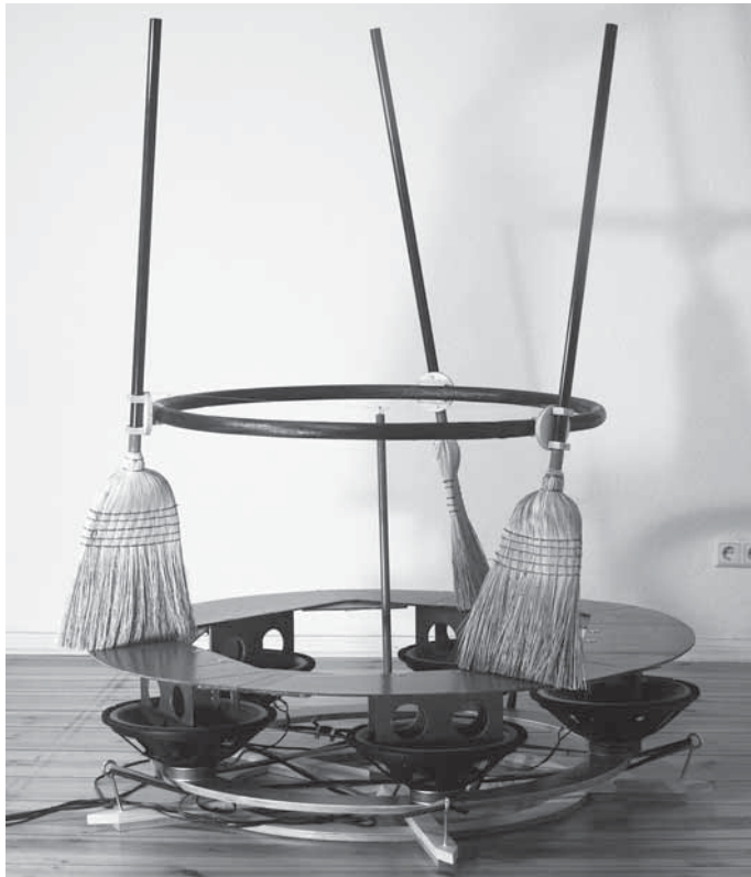
„Großer Hexenkreis“, Soundinstallation, 2019, ca. 180 x 120 x 120 cm

schen Chorraums, der Bestandteil der Galerie ist, nutzt er für eine begehbare, interaktive Sound-Installation. Die Ausstellung ist Teil des Jubiläumsprogramms „25 Jahre Galerie der Stadt Backnang“ und läuft noch bis 27. November. Die regulären Öffnungszeiten der Galerie sind Dienstag bis Freitag von 17:00 bis 19:00 Uhr sowie Samstag und Sonntag von 14:00 bis 19:00 Uhr.