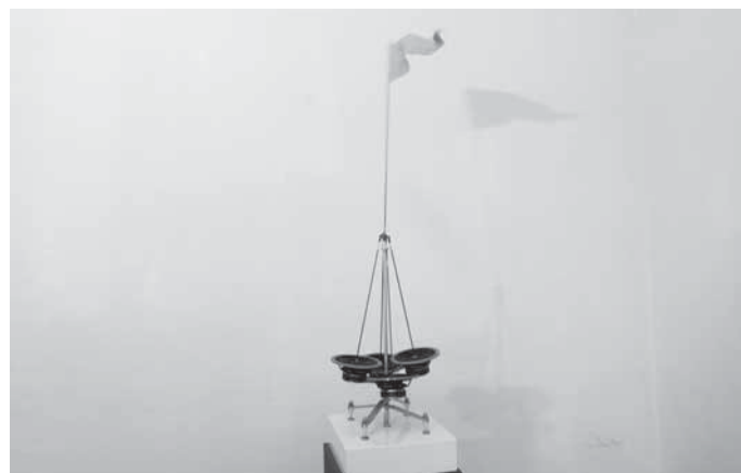
„Another Flag of Convenience“, Soundskulptur, 2022, 160 x 50 x 50 cm