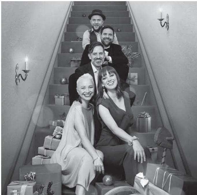
Mit ONAIR auf der Bühne zu stehen ist im Backnanger Bürgerhaus möglich.

Weitere Informationen sowie Tickets für das Konzert gibt es ab 19 Euro und ermäßigt ab 15 Euro zu den üblichen Öffnungszeiten im Backnanger Bürgerhaus, unter 07191 894-567 und buergerhaus@backnang.de sowie online unter www.backnanger-buergerhaus.de .