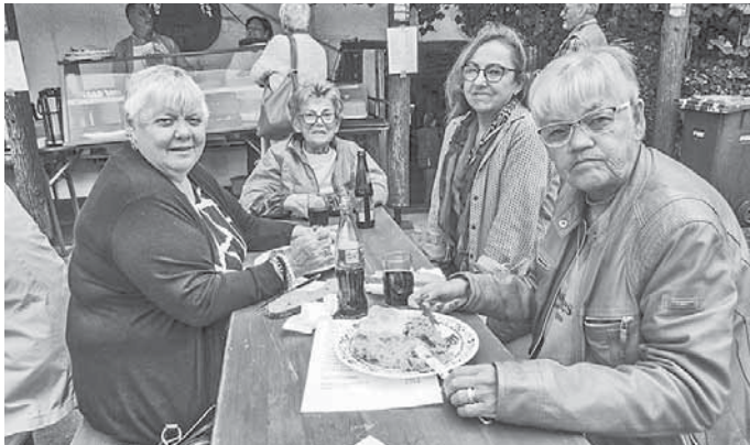
Für unsere Gäste waren die Schlachtplatten eine Gaumenfreude!

Euer Gesangsverein „Harmonie“ Waldrems-Heiningen