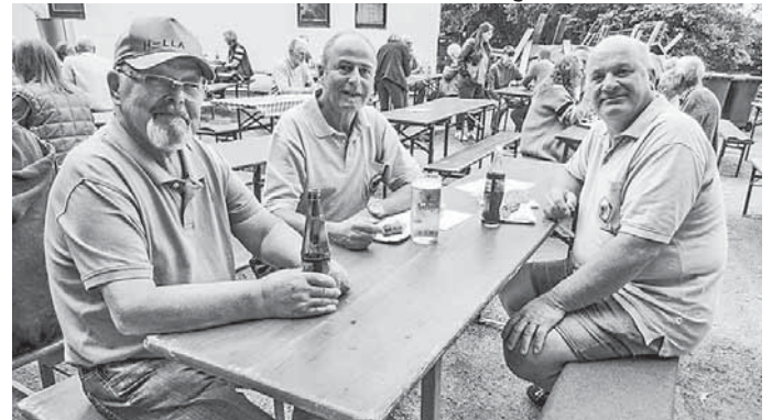
Einige Mithelfer beim Schlachtfest machen eine verdiente Pause!

Die letzten Vorbereitungen und Kleinigkeiten wurden am Samstagvormittag vollends in die Hand genommen und erledigt, so dass wir pünktlich zum offiziellen Beginn leckere Schlachtplatten, Getränke und Co. an unsere Gäste ausgeben konnten.