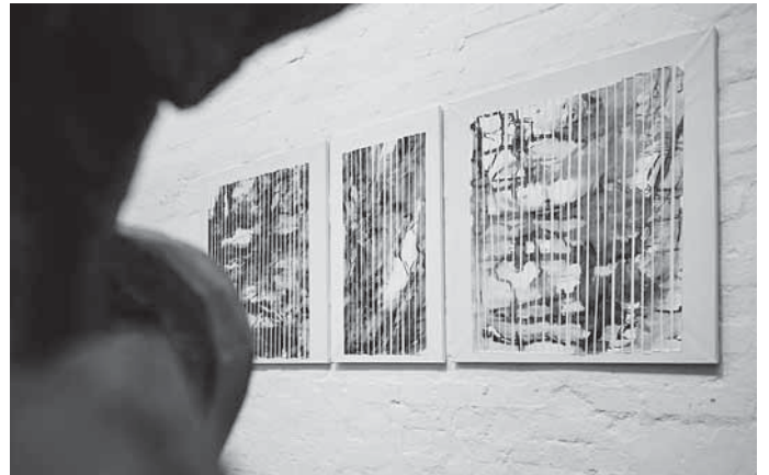
Ausstellungsansichten »Human Gardening - Seeds for the future« in der Q Galerie für Kunst

Eine Anmeldung ist nicht erforderlich. Der Eintritt inkl. Führung und Sekt beträgt 7 Euro. Die Ausstellung ist noch bis zum 30. Juli 2023 zu sehen. Informationen zu weiteren Führungen unter: www.q-galerie.de oder per E-Mail unter post@q-galerie.de , telefonisch unter 07181/99 27 940.