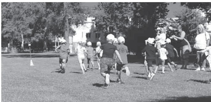
Die erste Gruppe der Kita Heiningerg Weg beim Start.

Dank einiger Firmen wurde der ECO-Run mit insgesamt 1.100 Euro unterstützt. Die Kinder, Eltern und Pädagogischen Fachkräfte freuen sich sehr über den gelungenen ECO-Run und die Möglichkeit, das „Kleine-Gärtner-Projekt“ in der Kita umsetzen zu können.