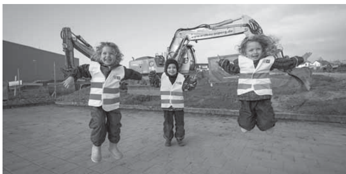
Die Kinder der Sportkita freuen sich über den Start der Bauarbeiten.

In Kooperation mit der TSG Backnang 1846 e.V. sollen verschiedene Aktionen mit den Abteilungen des Vereins organisiert werden, sodass die Kinder frühzeitig unterschiedliche Sportarten kennenlernen können. Diese können in der Kita, der nahegelegenen Katharinenplaisir-Halle oder draußen stattfinden. Der 1.260 Quadratmeter große Neubau, der als teilweise zweigeschossiges Gebäude in den Hang eingebettet sein wird, wird durch einen großzügigen Freibereich ergänzt, der den Kitakindern viel Platz zum Spielen und Toben auch im Freien ermöglicht. Der moderne Stahlbeton/Holz-Hybridbau mit dreifach verglasten Aluminiumfenstern sichert mithilfe einer Bauteilaktivierung auch bei veränderten Klimabedingungen für ein gutes Raumklima. Durch eine Ergänzung des bestehenden Fußwegs zwischen dem Berliner Ring und dem Wohngebiet in der Plaisir mit einem Serpentinweg, wird die Kindertageseinrichtung stufenfrei zugänglich sein. Außerdem wird eine auf dem begrünten Flachdach installierte Photovoltaikanlage die Stromversorgung des Neubaus übernehmen.