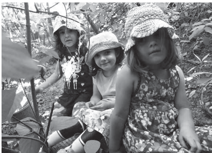
Kinder im Garten: Die Kinder der Kita Lindenstraße freuen sich auf das nachgeholte Jubiläumsfest im Jahr 2021.

Die Kinder und Familien mit ihren individuellen Themen zu begleiten und unterstützen, liegt den Pädagoginnen der Lindenstraße sehr am Herzen. Beim Erörtern, Erklären und Vermitteln, beim Gratulieren, Loben und Versöhnen, bei Streit, Problemen und Konflikten stehen die pädagogischen Fachkräfte den Kindern zur Seite. Diese werden ermutigt, sich ihre eigenen Gedanken zu machen und lernen diese zu formulieren. Auch wenn eine große Feier mit vielen Gästen derzeit nicht möglich ist, freuen sich die Erzieherinnen, Kinder und Eltern über einen Ort, an dem seit 50 Jahren das Vertrauen in die Ressourcen der kindlichen Entwicklung, der Blick auf das Gute im Menschen, die Achtung vor dem Anderen und eine wertschätzende Beziehungsgestaltung im Vordergrund stehen.