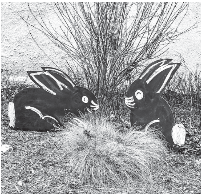
Unsere Hasen sind auch wieder dabei.