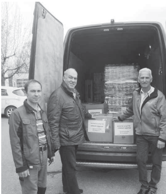
Übergabe an den ukrainischen Fahrer

Spontan und schnell sind 2000 Würste vom Fleischmarkt Waldrems, je 600 Flaschen Mineralwasser kamen von der Steuerberatung Apperger + Idler Backnang und von Waagenbau Ebinger aus Fichtenberg. Weiter gab es 25.000 Streichholzschachteln von der Firma Baumann Zündhölzer Oppenweiler, 800 Lollis spendete die Firma Sadex aus Hertmannsweiler und wir, der Dorf- und Backhausverein legten 800 Päckchen Brausestäbchen noch dazu. Auch reichlich Kleiderspenden von Privatpersonen trafen bei uns ein, so dass wir einen Kleintransporter voll Spenden übergeben konnten.