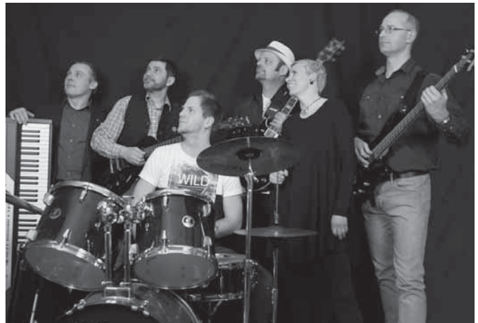
Die Band „Time Machine“ der Jugendmusik- und Kunstschule Backnang.

Am Freitag, 6. Mai, um 19.30 Uhr, findet im Merlin Backnang die Bandnight unter dem Titel „Hits Only“ statt. Vier Bands der Jugendmusik- und Kunstschule sorgen für Stimmung und gute Laune an diesem Abend in Backnangs bekannter Party-Location.