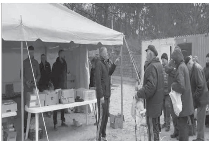
Verteilung der Spenden in der Ukraine

Unterstützen auch Sie unsere Arbeit für Waldrems, für soziale Projekte und das Miteinander in der Gemeinschaft. Werden auch Sie Mitglied im Dorf- und Backhausverein Waldrems e.V..