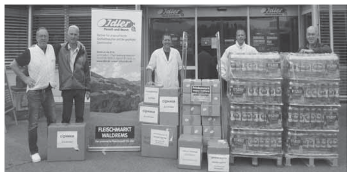
Ergebnis unseres Spendenaufufes

Auch wir, der Dorf- und Backhausverein Waldrems sind von den Kriegshandlungen und dem Leid der Menschen in der Ukraine sehr betroffen. Da wir uns bereits in der Vergangenheit für die Gemeinschaft in Waldrems und für soziale Projekte eingesetzt haben (Flammkuchen für Flutopfer Ahrweiler, Erweiterung der Bouleanlage, Backtag mit der Zukunftswerkstatt Rückenwind“, Backen mit Kindergartenkinder) war schnell klar, dass wir auch den Menschen in der Ukraine helfen wollen.