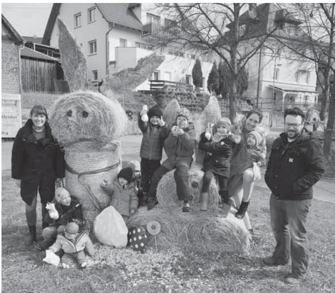
„Ein österlicher Spaziergang der Kirchenmäuse“