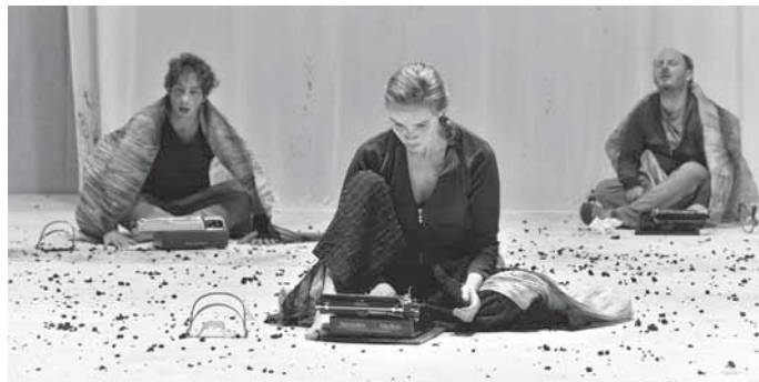
Die WLB Esslingen tritt im Backnanger Bürgerhaus mit der Tragödie Antigone auf.

Tickets für die Veranstaltung gibt es ab 19 Euro und ermäßigt ab 15 Euro im Backnanger Bürgerhaus unter der Telefonnummer 07191 894-567 oder per Mail an buergerhaus@backnang.de sowie online unter www.backnanger-buergerhaus.de . Das Tragen einer FFP2-Maske wird empfohlen.